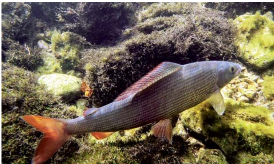
Lipani iz Save Bohinjke

V slovenskih sladkih vodah živi več kot 90 vrst rib. Posebno so pomembne avtohtone, domorodne ribje vrste, ki so po eni strani veliko naravno bogastvo naših voda, po drugi strani pa so zelo cenjene tudi med športnimi ribiči. Prav avtohtone ribje vrste in njihov dober stalež sta izjemnega pomena za ribolovni turizem pri nas. Kot posebnost jadranskega porečja veljata soška postrv ( Salmo marmoratus ) in soški lipan ( Thymalus thymalus ), posebnost rek donavskega porečja pa so sulec ( Hucho hucho ), potočna postrv ( Salmo trutta fario ) in lipan ( Thymalus thymalus ). Na osnovi ribiških gojitvenih načrtov ribiške družine skrbijo za stanje in ohranjanje