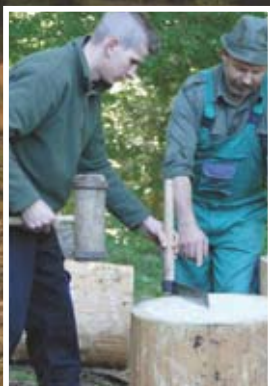
Prostovoljski program - vrnimo skodlo na svoje strehe.

Izkoristite preleste planinarjenja, steze so primerne za vso družino. Izberite si primerno svojim sposobnostim in željam. Na približno 100 kilometrih označenih pešpoti boste zagotovo našli kakšno kot ustvarjeno za vas.