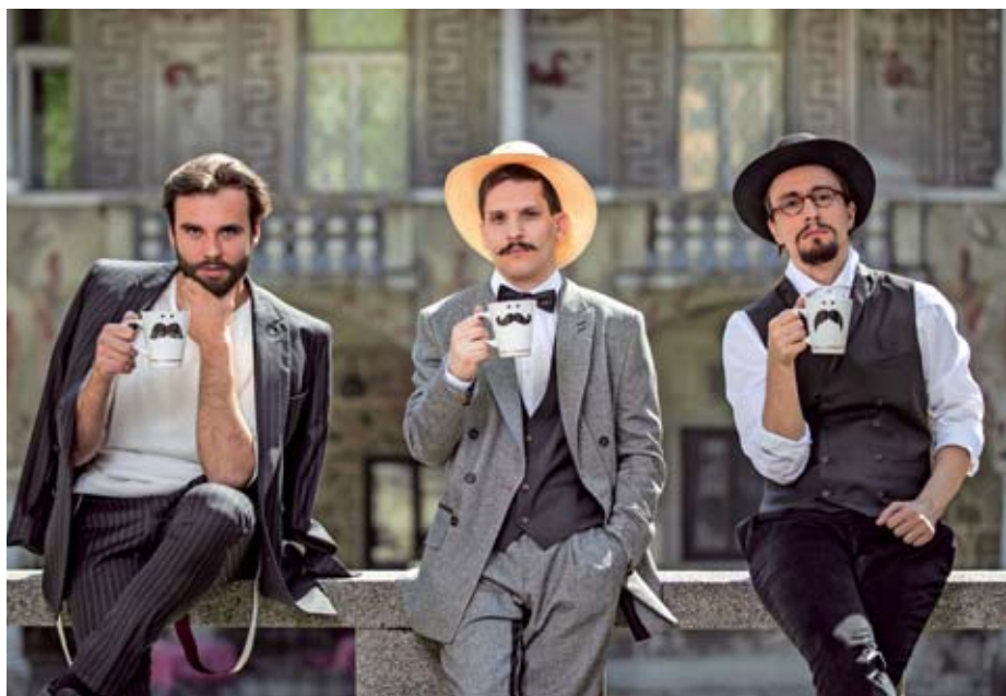
Brkači pred ljubljanskimi Križankami.

»Ljubljanski turizem je lani dosegel zastavljen strateški cilj – podaljšanje dobe bivanja. Povprečna doba bivanja po do sedaj znanih podatkih za prvih deset mesecev leta 2018 je namreč 2,5. Posledica daljše dobe bivanja je tudi rast števila nočitev, do oktobra so gostje v Ljubljani opravili že prek 2.000.000 nočitev. Pri tem velja poudariti, da se je število turistov najbolj povečevalo v mesecih, ki so praviloma slabše obiskani – aprila, maja in novembra,« pove mag. Petra Stušek , direktorica Turizma Ljubljana, ki ne pozabi omeniti desezonalizacije obiska. Nenaza-