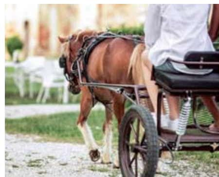
Grad Rakičan in kočija