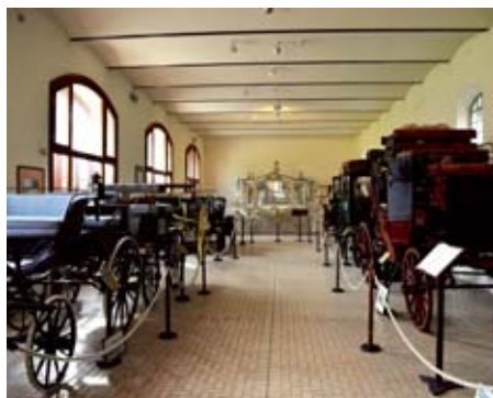
Muzej kočij na Madžarskem je največji v tem delu Evrope.