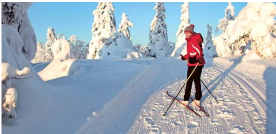
Tek na smučeh ponuja vrsto užitkov za vse ljubitelje zdravega življenjskega sloga.

rekreativnim smučarskim tekom najdemo tudi napovedi tekaških preizkušenj, dobrodošle podatke glede organiziranih tekaških prog v Sloveniji in stanje prog pri nas.