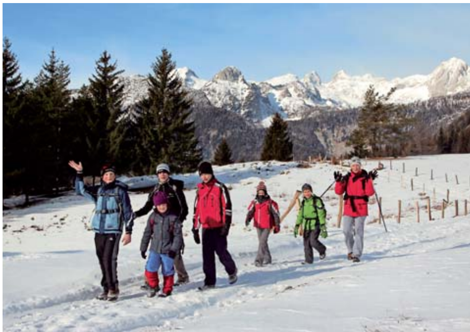
Tekmovanje Mladina in gore mlade planince že tri desetletja pripravlja na varnejši in samostojen obisk gora.