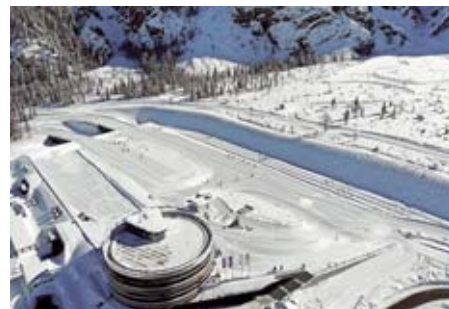
V Planici v zadnjih letih opažajo ogromno rast zanimanja za smučarski tek.

»V zadnjih letih opažamo ogromno rast zanimanja za tek na smučeh, ne samo pri starejših generacijah, pač pa je postal neverjetno priljubljen tudi med mladimi. Tekaško dvorano je lani obiskalo rekordno število obiskovalcev. V letu 2018 je v dvorani teklo prek 4800 tekačev, od tega več kot 3000 tujih. Večinoma gre za tekmovalce, ki v Planici trenirajo za prihajajočo sezono. Od tujih je bilo največ Avstrijcev in Italijanov ter Kitajcev. Veseli