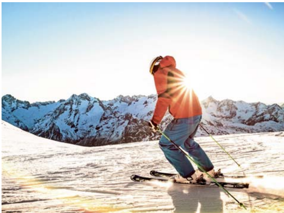
Na bele strmine se podajte odgovorno in ne pozabite na smučarski bonton.

miss Krvavca, marca se obeta Vrhunec zime z legendami, aprila pa tradicionalna Luža.