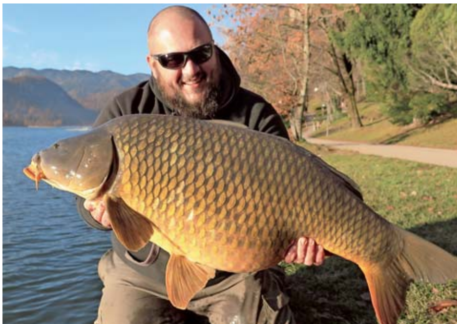
Trofejni krap iz Bohinjskega jezera