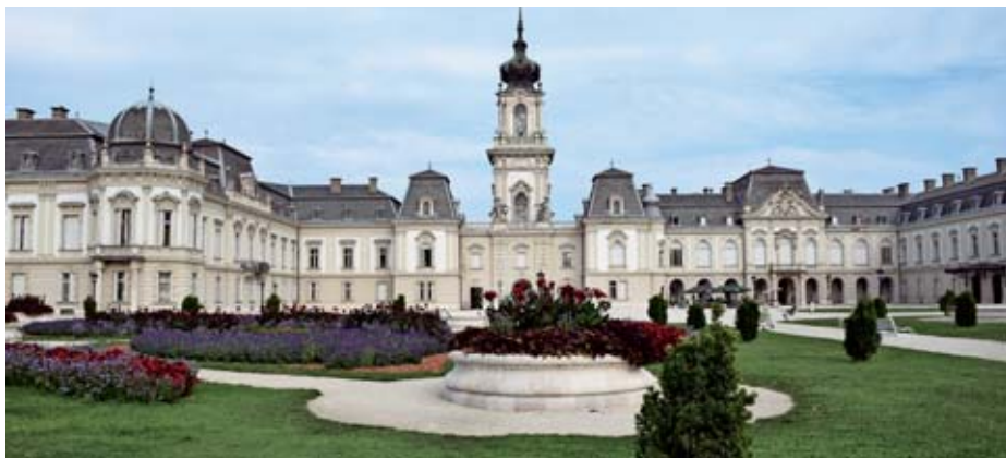
Palača Festetics na Madžarskem z muzejem kočij

P rojekt »Horse Based Tourism – HBT« z dolgim naslovom Svet konj – nova dimenzija trajnostnega razvoja za pristno doživljanje naravnih in kulturnih biserov čezmejnne regije, financiran v okviru bilateralnega Programa sodelovanja Interreg V-A Slovenija-Madžarska, odgovarja na izziv, kako povečati privlačnost čezmejnega območja za vse ciljne skupine turistov in jih spodbuditi, da v pokrajinah Pomurja, Podravja in madžarske Zale ne obiščejo samo vsem znanim turističnim magnetov, ampak se podajo na odkrivanje spregledanih ali skritih delov čezmejne regije. Inovativni programi doživetij so osnovani na konjeniškem turizmu in vabijo k odkrivanju naravnih biserov Pomurja, Podravja in madžarske pokrajine Zala.