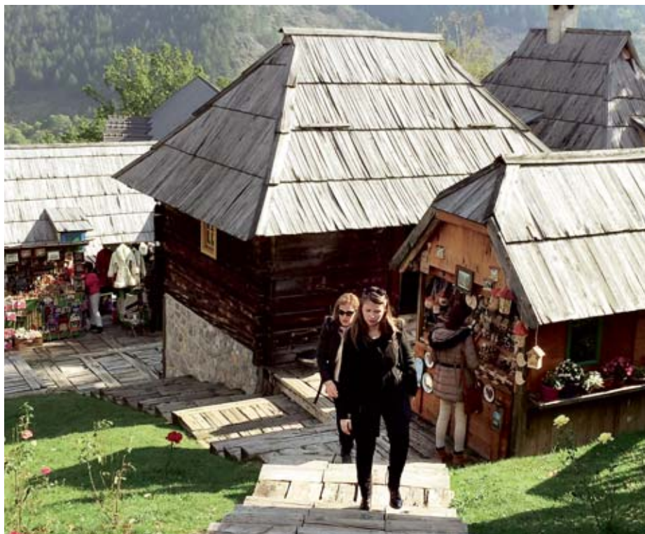
Na vzpetini Mečavnik, v vasi Drvengrad ali Küstendorf lahko na tržnici z nekaj stojnicami kupite lokalne in domače izdelke.

V vasi, kjer je hotel, lahko najamete sobo ali apartma. Tako boste za bivanje v vasi, kjer razen Kusturice ne živi nihče, za najem apartmaja v glavni sezoni odšteli od 90 do 140 evrov, polpenzion v dvoposteljni sobi pa dobite že za dobrih 35 evrov. In če boste imeli srečo ter obisk vasi načrtovali ali zgolj po naključju obiskali v času filmskega festivala, kdove, morda na ulicah srečate dobrega prijatelja gostitelja Johnnyja Deppa ali Monico Bellucci, ki je s Kusturico nastopila v njegovem zadnjem filmu Na mlačni poti.