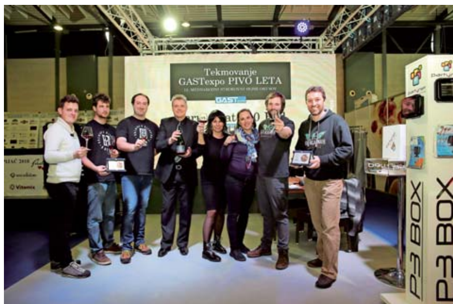
GASTexpov izbor pivo leta je pokazatelj, katera piva bodo letos trendovska.

»Kulinarika na splošno je postala že sama po sebi trendovska, uvajajo se nove tehnike kuhanja, ki stremijo k bolj zdravemu kuhanju s svežimi sestavinami. Tudi kuharski tečaji so vse bolj obiskani in