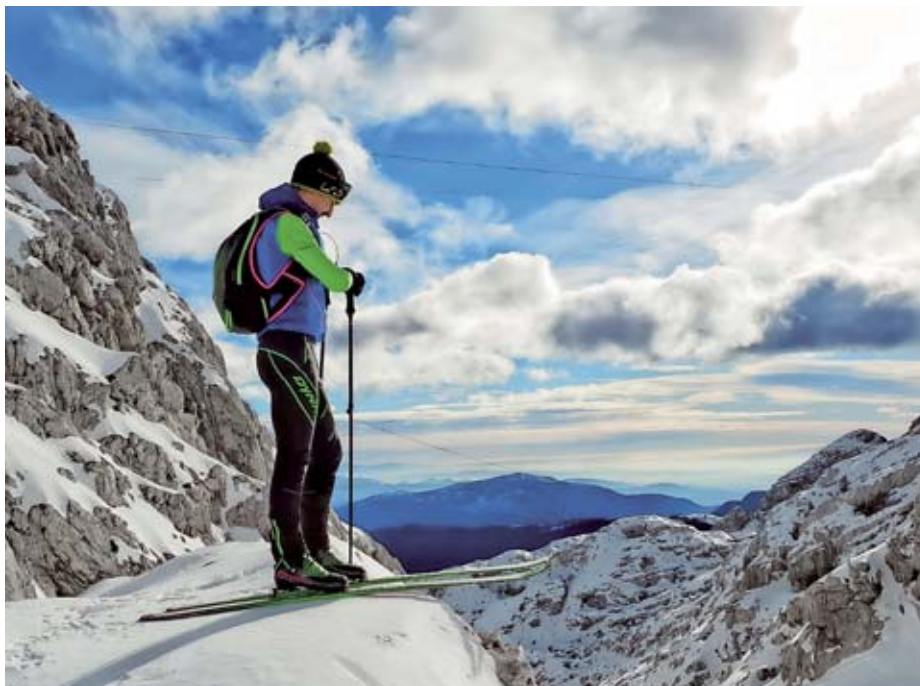
Pri turnem smučanju se je treba zavedati tveganj, ki so prisotna v gorah pozimi