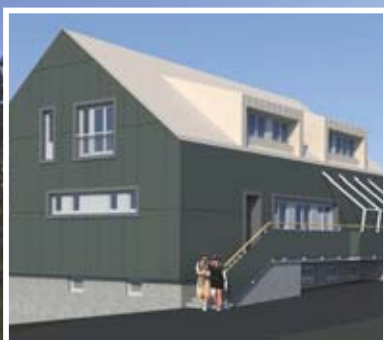
3D model Prostovoljskega centra Avtor projekta: Darko Stresec

jetnem okolju Prostovoljskega centra in raziskujete izbrane atrakcije parka: vrhove Risnjaka in Snježnika s prekrasnimi pogledi na zeleno notranjost in modro morje, skrivnostni izvir Kolpe, še vedno nerešeno kraško uganko. Naučite se kaj v središčih za obiskovalce in na učnih stezah. Oddahnite si, medtem ko vaši otroci uživajo v adrenalinskem parku, ali preizkusite vožnjo z električnim kolesom. Svoj aktivni dan pa končajte ob bogati kulinarčni ponudbi naše restavracije.