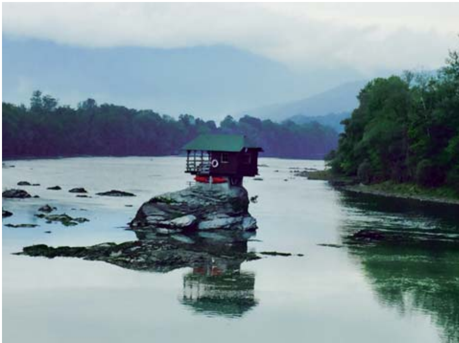
Pri Bajini Bašti na Drini ponosno stoji lesena hiša na skali.

K o omeniš Srbijo kot turistični cilj, večina najprej pomisli na njeno prestolnico, na Beograd, ki je pri Slovencih zelo priljubljen predvsem zaradi pestrega nočnega življenja, odličnih restavracij, žive glasbe in bogatih festivalov in poslovnih zabav. Ali preprosteje – Beograd je postal pravi kraj, kjer se združujeta posel in užitek. Toda Srbija, kot vsaka država na zemeljski obli, skriva dragulje, geografske sladkorečke, za katere se dolgo ni vedelo, da sploh obstajajo. Med prvimi, tako pravijo domačini, so jih ponovno začeli odkrivati številni Slovenci. Razlog? Morda nostalgija po nekdanji skupni državi Jugoslaviji, zagotovo pa gostoljubnost, odlična kulinarika in vsako leto bogatejša ponudba športnih aktivnosti, ki jih, kot se radi pošalijo domačini, Slovenci od nekdanj iščemo.