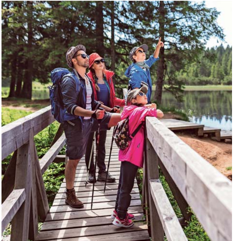
Bistriška pot je namenjena tako družinam kot drugim vedoželjnim popotnikom.

4. IGRARIJE TREH KRALJEV – potipaj, pogledj, povohaj, pojaj. Najdete jih pri Treh kraljih, kjer je urejena igralnica za geološki in gozdni vrtec, namenjena otrokom iz vrtca, šolskim skupinam in seveda tudi posameznim družinam. V prijetno opre-