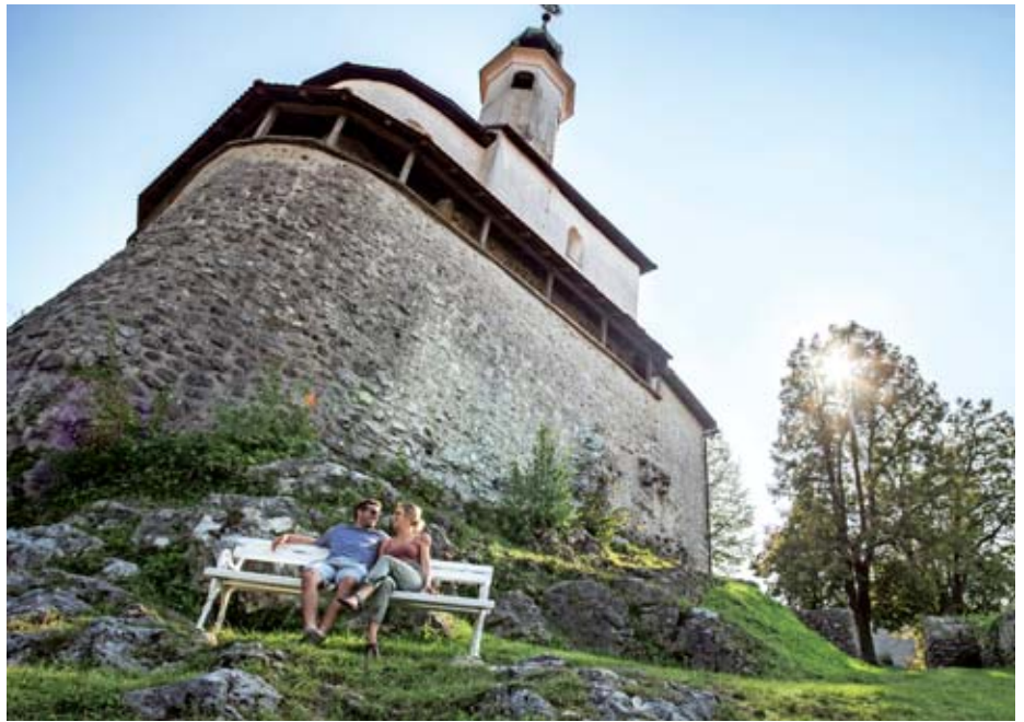
Mali grad

Stari grad nad Kamnikom pa privablja predvsem pohodnike in družine, saj je dostop do njega mogoč po manjšem vzponu. Na vrhu je gostinska ponudba. Zaradi odlične lege Starega gradu in ravno pravšnje višine – gre za enega najvišje ležečih gradov na Gorenjskem – sta bila vidljivost in nadzor nad srednjeveško tr-