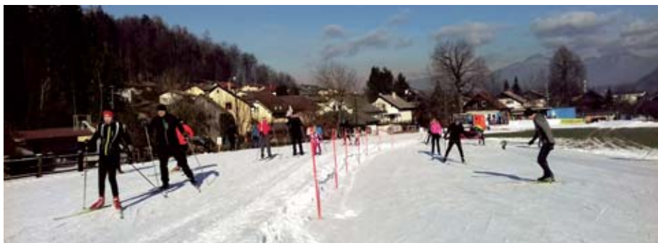
V NC Bonovec na svoj račun na tečajih teka na smučeh pridejo tudi začetniki.

Številne dobrodošle podatke, novice in odgovore na svoja vprašanja boste tekaški navdušenci našli tudi na sejmu Alpe-Adria. »V sodelovanju s Smučarsko zvezo Slovenije se bodo predstavili tekaški cilji, ki so za to pokazali interes. Prisotni bodo tudi nekateri predstavniki teh lokacij,« napoveduje Rebolj.