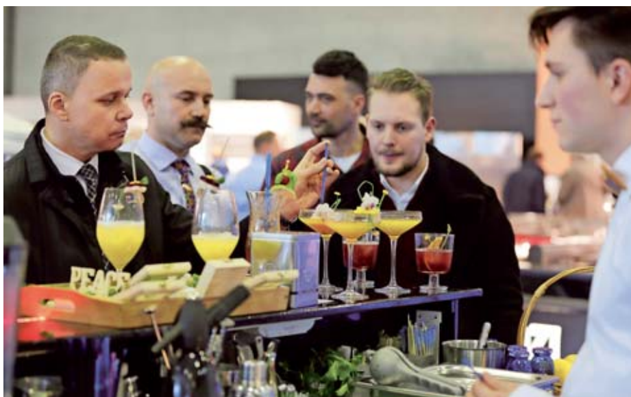
V času sejma bosta potekali dve državni prvenstvi v pripravi koktajlov.

Letošnji sejmski program se začneja s priljubljeno pico, zgodilo se bo tudi tekmovanje za najpicopeka, ki poteka v