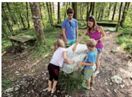
Firstova miza

Legenda o skopuški Veroniki je dobro poznana v Kamniku ter njegovi okolici. Opisal jo je že Janez Vajkard Valvasor v svoji Slavi vojvodine Kranjske, Veronika pa je danes tudi simbol Kamnika. Morda si lahko pred obiskom mesta preberete njeno zgodbo in se kot pravi junaki odpravite do Malega gradu rešit ubogo dekle. Seveda le, če ste dovolj pogumni. Sicer pa Kamnik s svojo okolico ponuja veliko zanimivih izletov. Eden najbolj zanimivih je zagotovo obisk Velike planine, a tudi dolina Kamniške Bistrice skriva veliko zanimivih kotičkov. Prav tako priporočamo obisk Arboretuma Volčji Potok in obisk Tuhinjske doline, kjer so najvišje ležeče terme v Sloveniji – Snovik. Tistim, ki imajo raje vzpone, pa ponudimo vzpon na Sv. Primož oziroma Stari grad nad Kamnikom. Ljubitelje zdravega načina življenja bo navdušil obisk Zdravilnega gaja Tunjice.