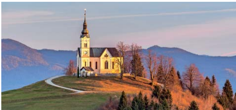
Črni vrh

Del kulturnega turizma je tudi kulinarika, ki postaja vedno pogostejši motiv prihoda tujih obiskovalcev. Turizem Ljubljana že dalj časa aktivno razvija integralne turistične produkte, v katere so vpete lokalne dobrote Ljubljane in osrednjeslovenske regije. »Podpiramo tudi projekte, ki poudarjajo pomembnost bogate kulinarčne ponudbe Ljubljane in Slovenije ter prispevajo k razvoju gastronomskega turizma. Če omenim le Okuse Ljubljane, Ljubljansko vinsko pot, prireditev GourmetCup,