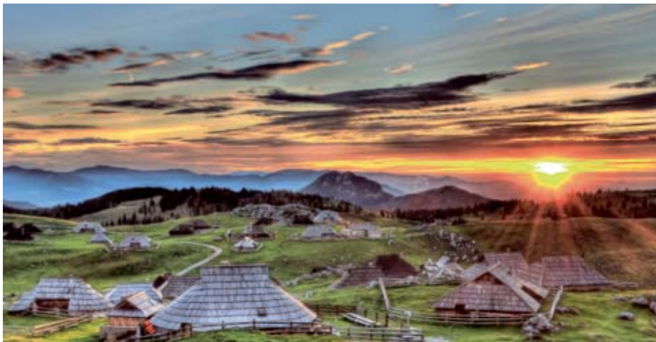
Velika planina

Starodavni način življenja pastirjev in pogled na najvišje vrhove Kamniško-Savinjskih Alp sta le dva razloga, ki sta samo lani na Veliko planino privabila več kot 200.000 obiskovalcev z vsega sveta. Čeprav je glavna turistična sezona na Veliki planini poleti, ko planina ob prihodu pastirjev in seveda krav zaživi, lahko turisti poleg pohodništva, kolesarstva in dobre kulinarike v kočah na Veliki planini občudujejo tudi naravne znamenitosti, kot so znamenito pastirsko naselje, kapela Marije snežne, jami Veternica in Dovja griča na Mali planini, obišejo lahko Preskarjev muzej. Zanimiva je tudi pozimi, ko jo pobeli sneg. Letošnja novost so otroški zimski park ter tekaške proge. Obiskovalci se bodo kot doslej čez dan od četrta do nedelje smučali, zvečer pa sankali po osvetljeni sankiški progi.